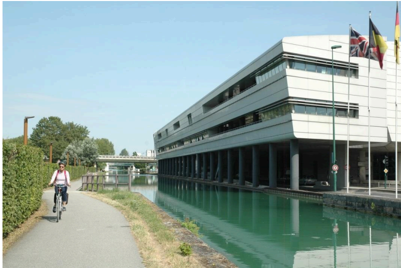
Centre des Congrès