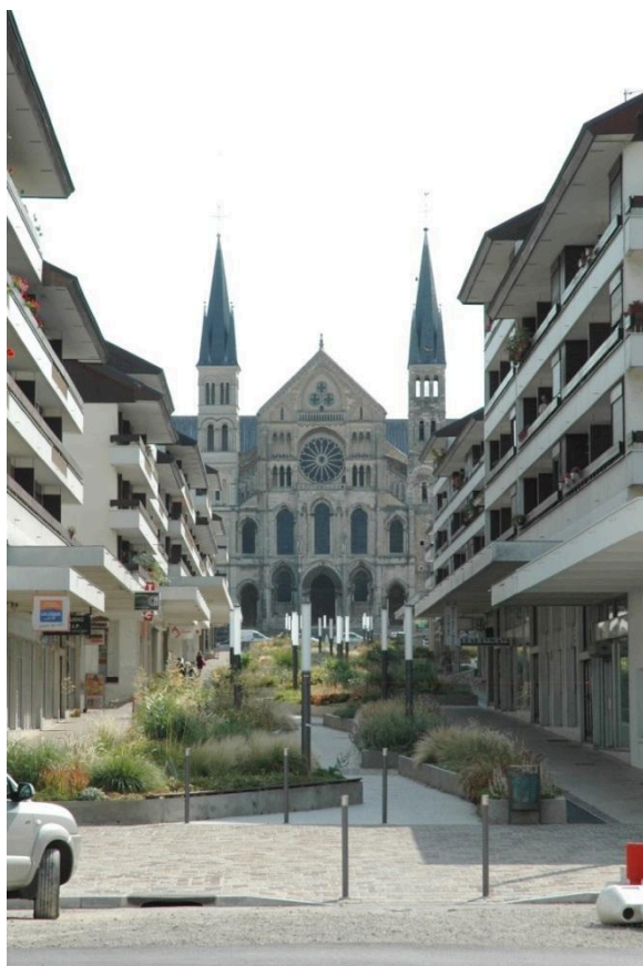
la Basilique Saint-Rémi