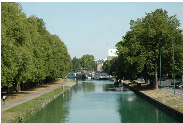
zone d'embarquement de 60 mètres